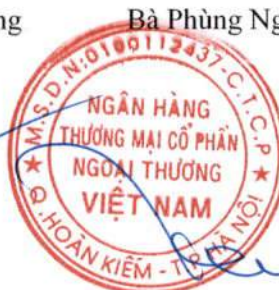
Phó Tổng Giám đốc