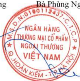
Phó Tổng Giám đốc