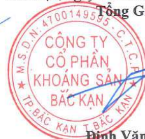
Đình Văn Hiến