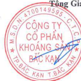
Đình Văn Hiến