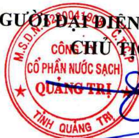
Đào Bá Hiếu