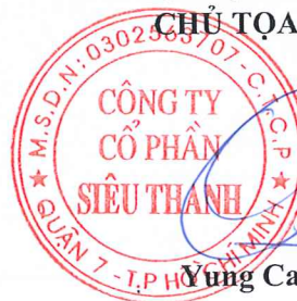
Yung Cam Meng