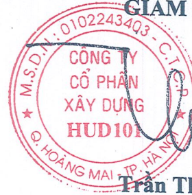
Trần Thế Tài