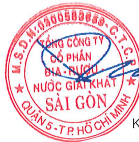
Koh Poh Tiong