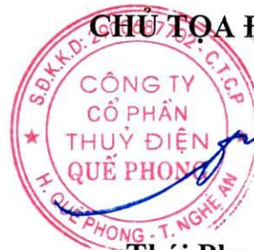
Thái Phong Nhã