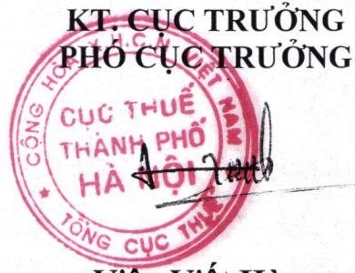
Viên Viết Hùng