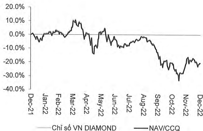
Biểu đồ thể hiện kết quả đầu tư của Quỹ so với chỉ số tham chiếu trong năm 2022