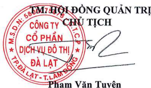
Phạm Văn Tuyên