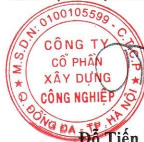
Đỗ Tiến Lợi