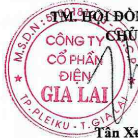
Tân Xuân Hiến