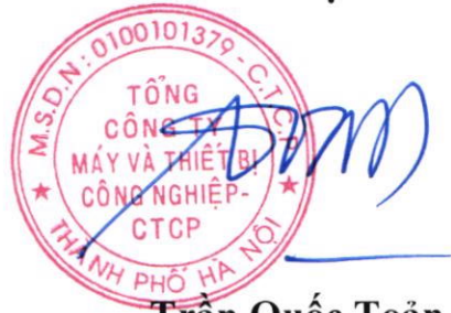
Trần Quốc Toàn