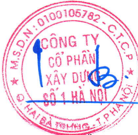
CHỦ TỌA HOÀNG VĂN HÒA

Đại hội đồng cổ đông thường niên năm 2023 của Công Ty Cổ phần Xây dựng số 1 Hà Nội kết thúc vào lúc 11 giờ 00 phút cùng ngày./.