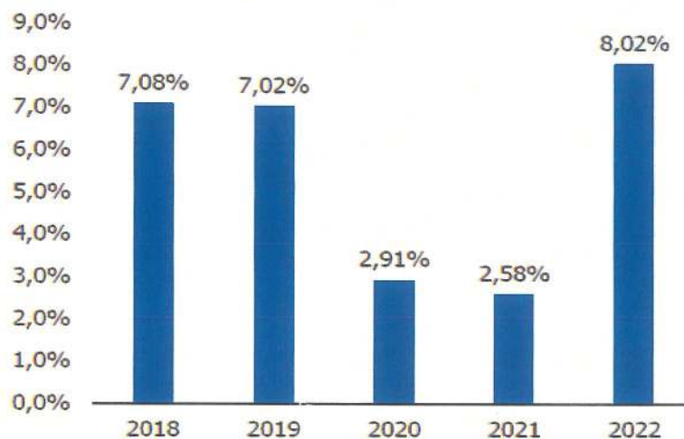
Tăng trưởng GDP (n/n) của Việt Nam