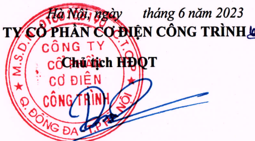
Cao tiến Dũng