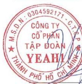
Lê Phương Thảo Chủ tịch HĐQT Ngày 28 tháng 7 năm 2022

Các thuyết minh từ trang 9 đến trang 52 là một phần cấu thành báo cáo tài chính hợp nhất giữa niên độ này.