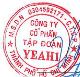
Lê Phương Thảo Chủ tịch HĐQT Ngày 28 tháng 10 năm 2022

Các thuyết minh từ trang 9 đến trang 51 là một phần cấu thành báo cáo tài chính hợp nhất giữa niên độ này.