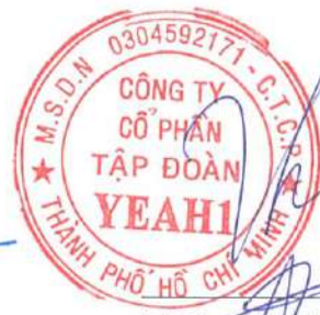
Lê Phương Thảo Chủ tịch HĐQT Ngày 27 tháng 04 năm 2023

Các thuyết minh từ trang 8 đến trang 38 là một phần cấu thành báo cáo tài chính riêng giữa niên độ này.