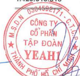
Lê Phương Thảo Chủ tịch HĐQT Ngày 27 tháng 04 năm 2023

Các thuyết minh từ trang 8 đến trang 38 là một phần cấu thành của báo cáo tài chính riêng giữa niên độ này.