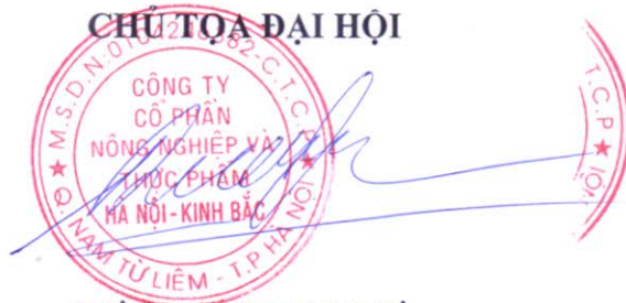
DƯƠNG QUANG LƯ