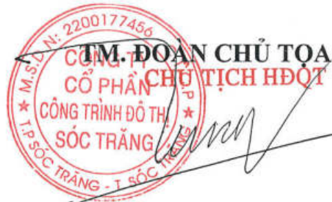
Lâm Hữu Tùng