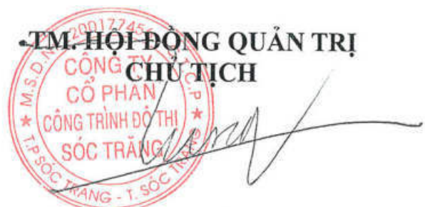
Lâm Hữu Tùng