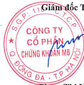
Phạm Thị Kim Ngân