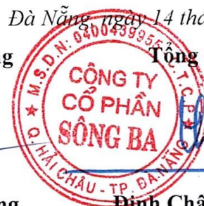
Đinh Châu Hiếu Thiện