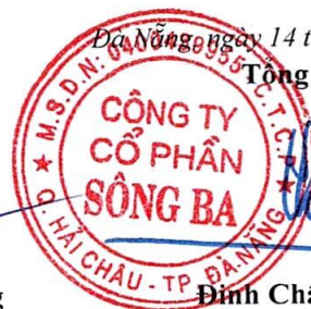
Đinh Châu Hiếu Thiện