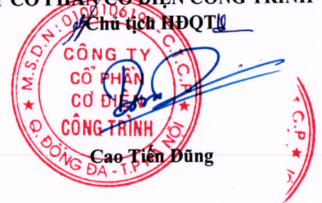
Cao Tiên Dũng