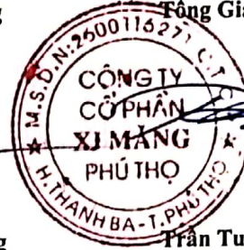
Trần Tuấn Đạt