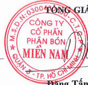
Đặng Tấn Thành