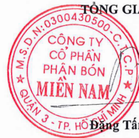
Đặng Tân Thành