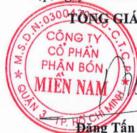
Đặng Tấn Thành