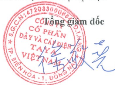
HSU CHING YAO