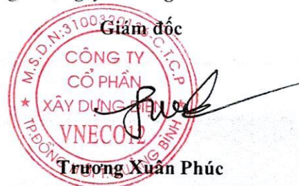
Trương Xuân Phúc