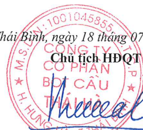
Ngô Tiên Cường