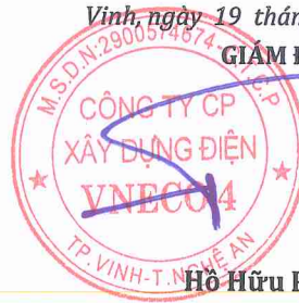
Hồ Hữu Phước