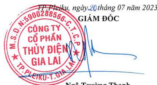
Ngô Trường Thành