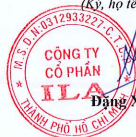
Đặng Xuân Hữu