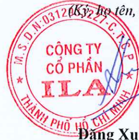
Đặng Xuân Hữu