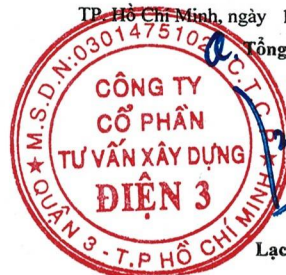
Lạc Thái Phước