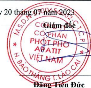
Đặng Thiên Đức