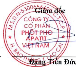
Đặng Tiên Đức