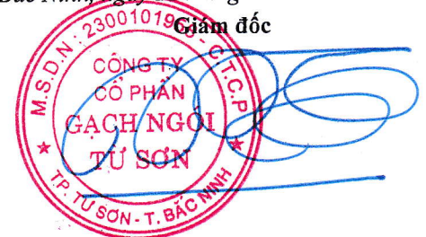
Trần Xuân Hùng