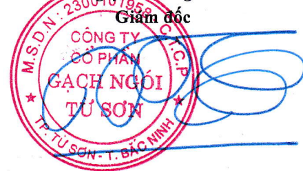
Trần Xuân Hùng