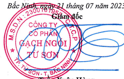
Trần Xuân Hùng