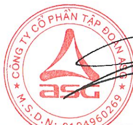
Dương Đức Tính Chủ tịch Hội đồng quản trị