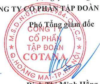
Trần Trọng Đại