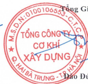
Đào Đức Thọ