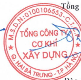
Đào Đức Thọ