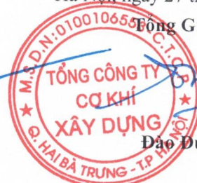
Đào Đức Thọ