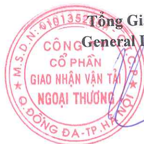
Trần Công Thành