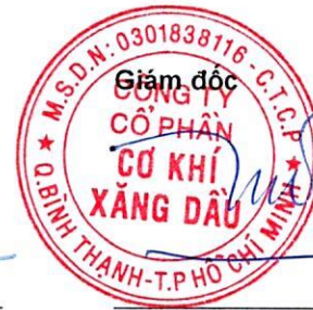
Đoàn Đắc Học