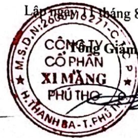
Trần Tuấn Đạt