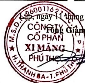
Trần Tuấn Đạt