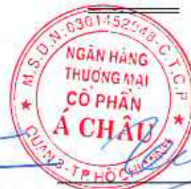
Trần Hùng Huy Chủ tịch Hội đồng Quản trị Ngày 10 tháng 8 năm 2023