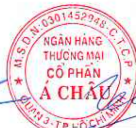
Trần Hùng Huy Chủ tịch Hội đồng Quản trị Ngày 10 tháng 8 năm 2023