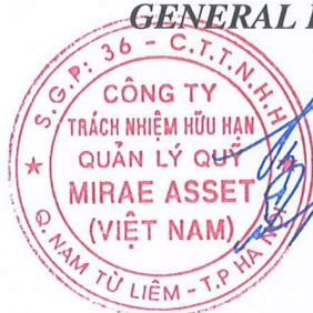
SOH JIN WOOK