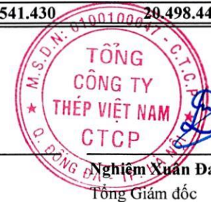
Nghiệm Xuân Đa