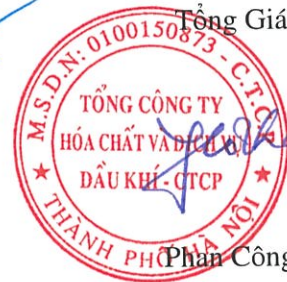
Phan Công Thành

Các thuyết minh đính kèm là bộ phận hợp thành của báo cáo tài chính hợp nhất giữa niên độ này