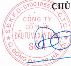
Đào Tiên Dương