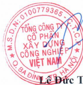
Lê Đức Thọ