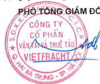
Đào Nguyên Đặng