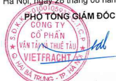
Đào Nguyên Đặng