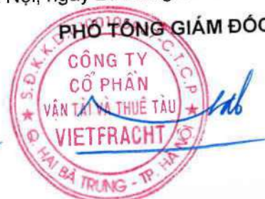
Đào Nguyên Đăng