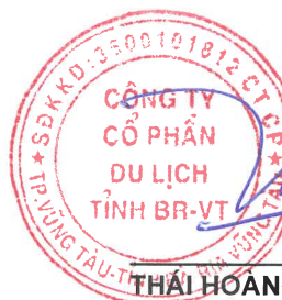
THÁI HOÀNG THÂN Chủ tịch Hội đồng quản trị Bà Rịa - Vũng Tàu, ngày 28 tháng 8 năm 2023