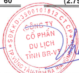
THÁI HOÀNG THÂN Chủ tịch Hội đồng quản trị Bà Rịa - Vũng Tàu, ngày 28 tháng 8 năm 2023